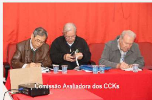
Comissão Avaliadora dos CCKs