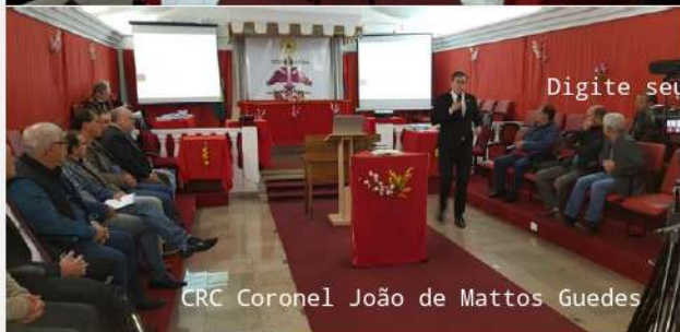
CRC Coronel João de Mattos Guedes