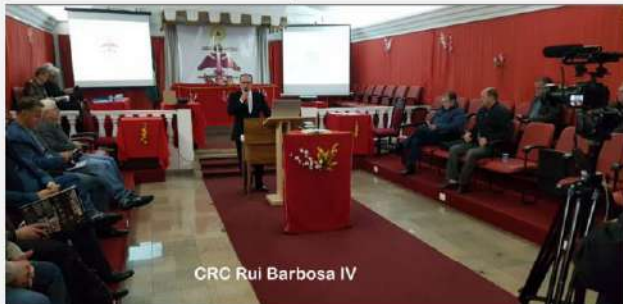
CRC Rui Barbosa IV