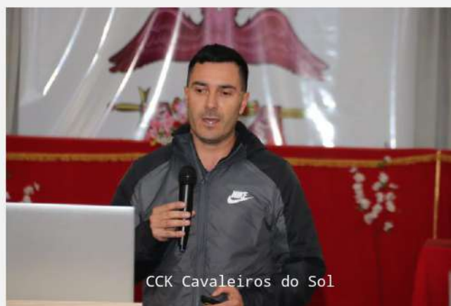
CCK Cavaleiros do Sol

Na parte da tarde, do mesmo dia 06/10/2018, logo em seguida a um saboroso almoço, servido no mesmo local – Associação Filosófica Phoenix, teve início o Seminário dos Conselhos de Cavaleiros Kadosh.