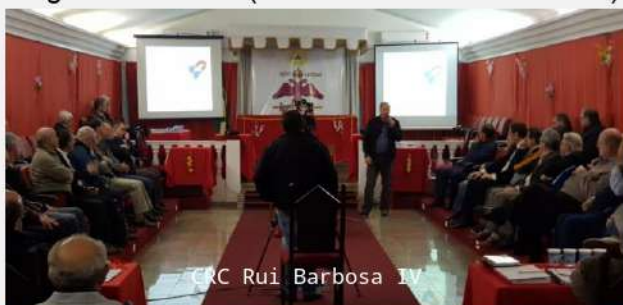
CRC Rui Barbosa IV

Referente ao 1º Painel, o primeiro Corpo a apresentar seus trabalhos foi o CRC Cel. João de Mattos Guedes - Curitiba, seguido pelo CRC Getúlio Pereira Salermo - Guarapuava, finalizando com o CRC Leopoldo Jorge Cardom (São José dos Pinhais).