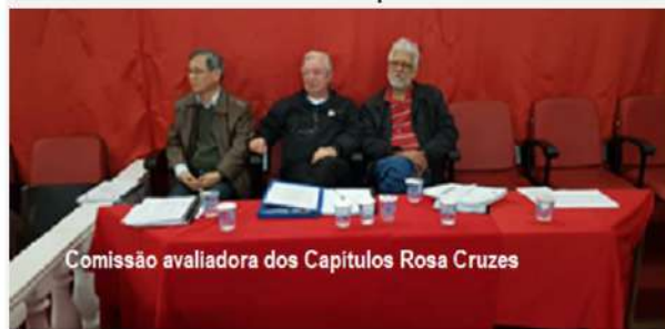
Comissão avaliadora dos Capítulos Rosa Cruzes

Kadosch para, através da partilha do conhecimento que cada Corpo conquistou, avançar no desafio de conquistar uma fé esclarecida pela razão, conhecer o homem e sua sociedade, para poder tornar feliz a humanidade. “Vamos aprender e ensinar”.